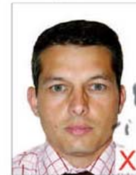
Traces / Pliures